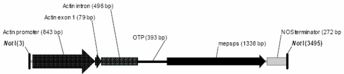
Figur 2. Rekombinant DNA-fragment i maisens genom.

Molekylærbiologiske analyser viser at det rekombinante DNA-fragmentet i planten inneholder seks påfølgende områder som stammer fra 3,49 kb NotI -restriksjonsfragment fra plasmidet pDPG434. Kopiene fra dette 3,4 kb rekombinante DNA-fragmentet blir av Syngenta benevnt som Copy 1 til 6. Southern-blot analyser viser at disse kopiene nedarves som et enkelt lokus.